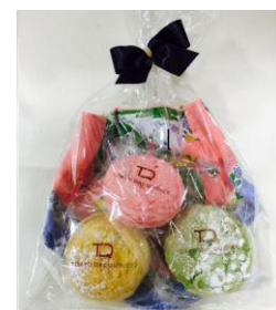
『東京ダコワーズ』と『大判ハンカチ』 のオリジナルギフト(イメージ)