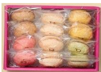
1F PARADIS/ARINCO 『東京ダコワーズ』 ギフトボックス 12個入り 1,879円

※オリジナルギフトの組み合わせ例を、1月下旬以降、オフィシャルウェブサイトなどでご紹介します