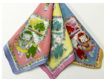
1F ホリデーアパートメント 『大判ハンカチ』 1枚 648円