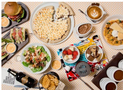
MAX BRENNER CHOCOLATE BAR